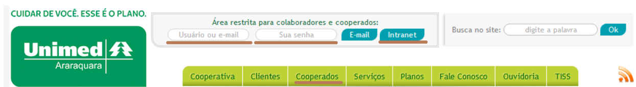
Figura 2 – Acesso para a área de Cooperados.

3 – Após o login, clicar em Cooperados .